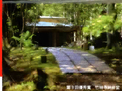
第3回優秀賞 竹林寺納骨堂