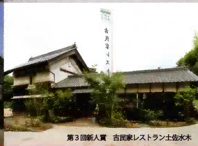
第3回新人賞 古民家レストラン土佐水木