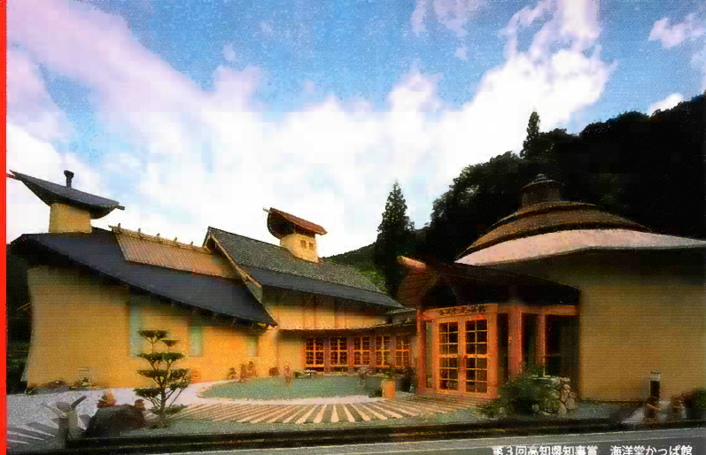
第3回高知県知事賞 海洋堂かっぱ館