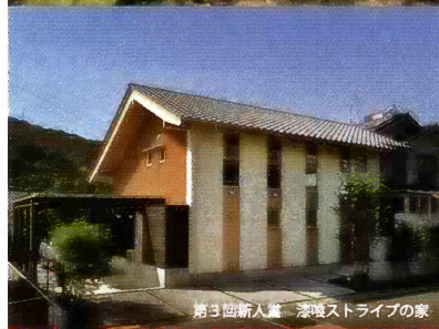
第3回新人賞 漆喰ストライプの家